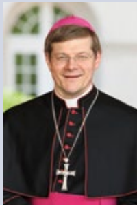
Stephan Burger Erzbischof der Erzdiözese Freiburg