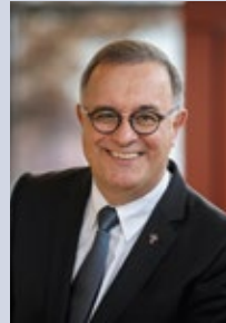
Dr. Gebhard Fürst Bischof der Diözese Rottenburg-Stuttgart